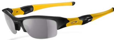
Jet Black(フレーム) ・ Satin Silver/Gold(アイコン) ・ Gold(イヤーストック) ・ Grey(レンズ)