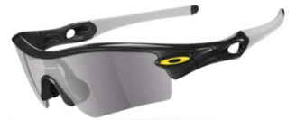
Polished Black(フレーム) ・ Team Yellow(アイコン) ・ White(イヤーストック) ・ Grey(レンズ)