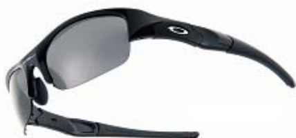
Flak Jacket （フラックジャケット）

2010年全米オープン開催の地、ペブルビーチゴルフリンクスの難コースに挑む選手が選んだオークリーアイウェアのモデルは、刻々と変化する天候にあわせて簡単にレンズ交換ができ、なおかつ豊富なレンズカラーが揃うデュアルレンズタイプのFlak Jacket（フラックジャケット）とシールドレンズタイプのRadar（レーダー）。アイアン・ポルターは、自身のシグネチャーモデルでもあるホワイトフレームとPositive Red IridiumレンズのFlak Jacket（フラックジャケット）を着用している。